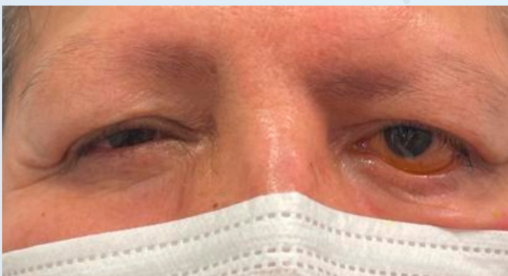
Imagen 1. Paciente con parálisis facial izquierda donde se evidencia ectropión de párpado inferior izquierdo y ptosis de ceja

Tres semanas después, volvemos a valorar a la paciente y en ese momento nos comunica gran mejoría de la sintomatología asociada a la queratitis. A la exploración, persiste el lagofthalmos asociado a la parálisis facial pero en el test de la tinción con fluoresceína no se aprecian apenas defectos epiteliales corneales. Como conclusión recalcamos la efectividad vista en pacientes con parálisis facial y queratitis asociada al lagofthalmos de la pomada Puro Protect aplicada antes de acostarse, insistiendo a la vez de mantener una constante lubricación diurna con lágrimas artificiales Puro cada 2 horas y Puro Epithel cada 8 horas.